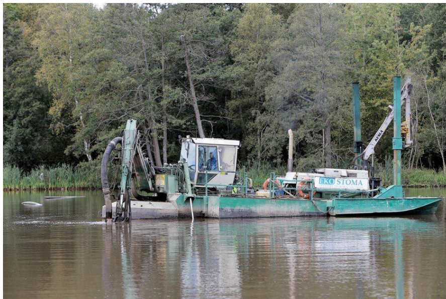
Klaipėdoje valomas Mumlaukio ežeras