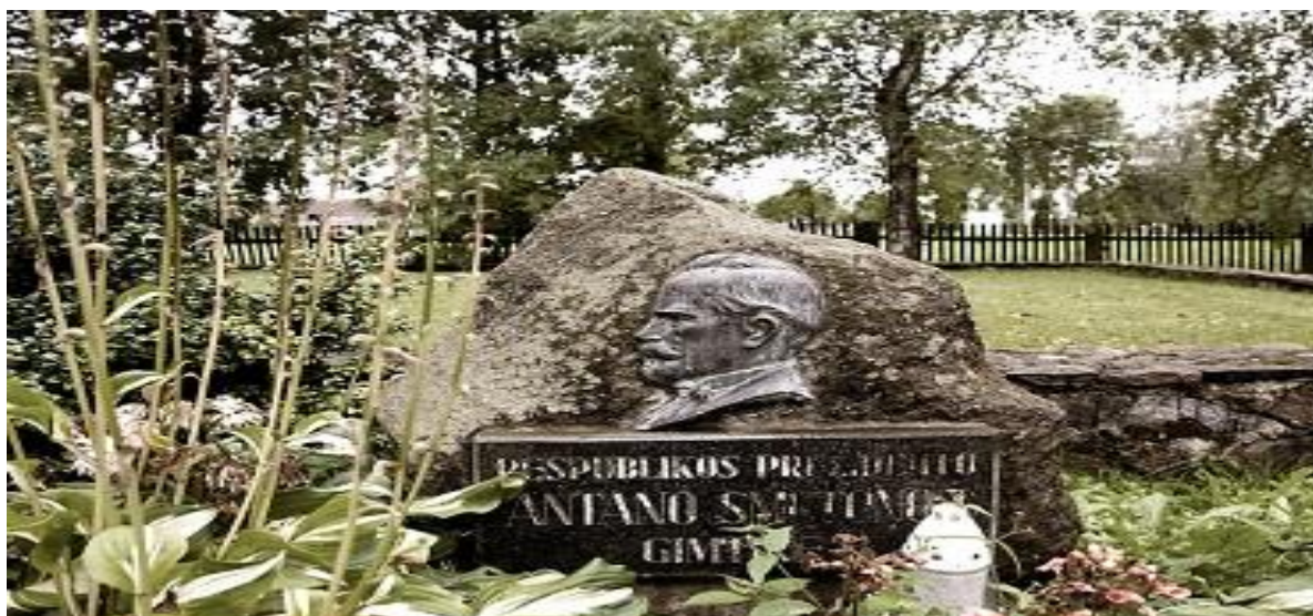
A.Smetonos gimtinė.

Su būsima žmona Sofija jis 1895 m. susipažino dirbdamas korepetitoriumi bajorų Chodakauskų