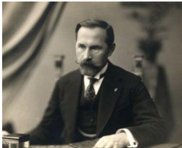
Lietuvos Respublikos Prezidentas Antanas Smetona

2018 08 07 14:30, Skiriama Prezidento Antano Smetonos 144-osioms metinėms