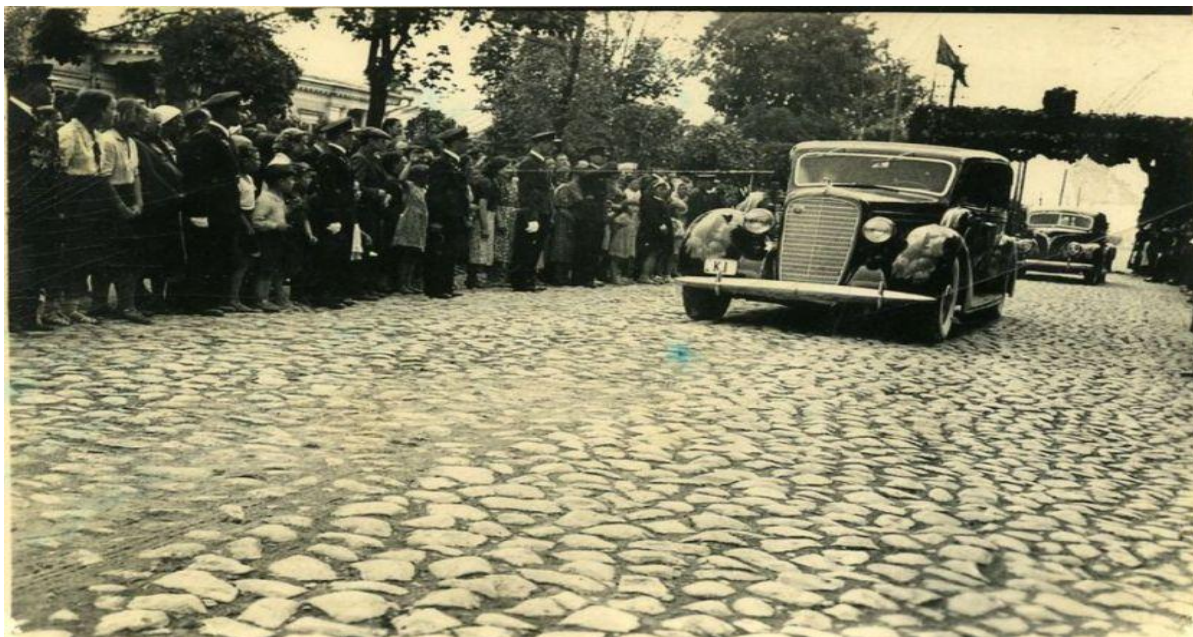
„Jaunlietuviai“ sutinka Prezidentą Ukmergėje, 1939 metų birželio 13 d./Ukmergės kraštotyros muziejaus nuotr. (LIMIS).