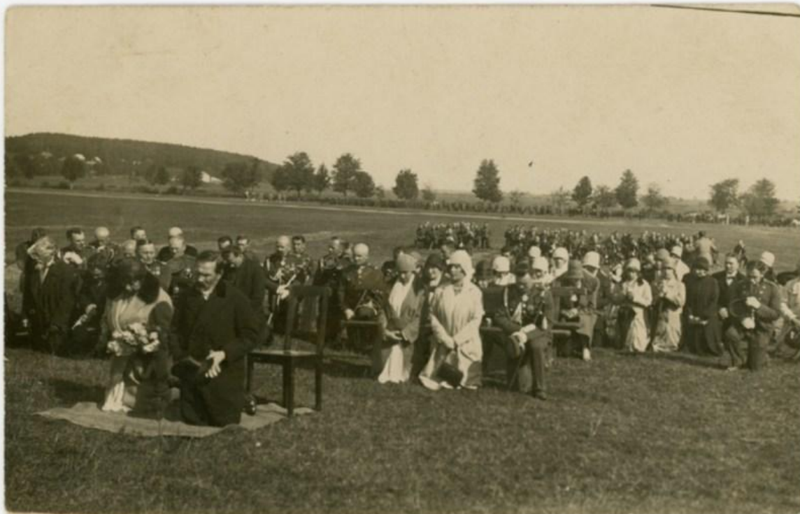
PRIESAIKA. LR prezidento Antano Smetonos portretas.

LR Prezidentu buvo išrinktas kelis kartus ir pareigas ėjo: 1919 m. balandžio 6 d. – 1920 m. birželio 19 d. bei 1926 m. gruodžio 19 d.–1940 m. birželio 15 d. Tiesa, jo prezidentavimą nutraukė sovietų okupacija. 1940 m. birželį A. Smetona išvyko į užsienį. Šis jo poelgis vertinamas kontroversiškai. Pirmiausiai jis pasiekė Vokietiją, po to Šveicariją, galiausiai įsikūrė JAV. 1944 m. sausio 9 d. keistomis aplinkybėmis A. Smetona žuvo gaisre nuomojame bute Klivlende (JAV).