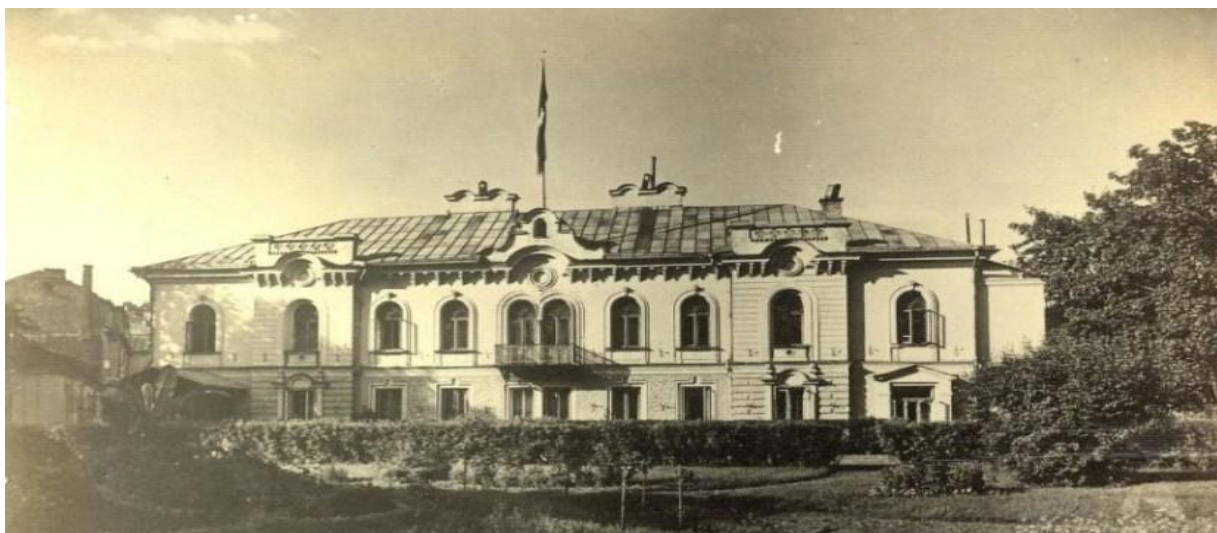
Prezidento rūmai Kaune, XX a. 3 deš.