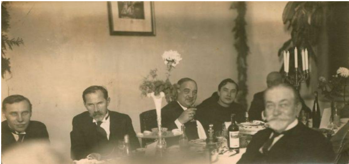
Prezidentas Antanas Smetona (antras iš kairės), kiti pobūvio svečiai. Apie 1930-1935 m.

Birželio 13 d. minint Antano vardadienį, dvare rengti dideli baliai. Šventėje patarnaudavo ir liokajai. Priešpiet svečiams dalinti maži sumuštiniai su mėsa, žuvimi, atsigerti duota kavos, alaus. A. Smetonienė alkoholio nevartojo, tačiau su vyru popiet mėgdavo rūkyti nedidelį papirosą. A. Smetona mėgo lošti kortomis. Anot kambarinės, Prezidento žmona nebuvo puošėiva, vieną suknelę galėdavo nešioti ir visą savaitę, mėgdavo rengtis tamsiai, dažydavosi ir šukuodavosi taip pat neįmantriai. Kambarinė S. Smetonienei turėdavo padėti išsimaudyti: nutrinti nugarą, plauti galvą, karpyti nagus.