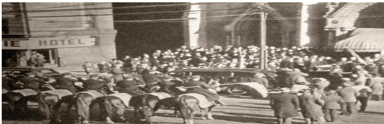
A.SMETONOS LAIDOTUVĖS 1944-01-13 Klivlande. Žuvo - 1944 m. sausio 9 d.

suteiktas VDU filosofijos garbės daktaro vardas. A. Smetona redagavo leidinius: „Lietuvos balsas“, „Lietuvos aidas“, „Krašto balsas“, „Lietuvos ūkininkas“, „Vairas“ ir kt.