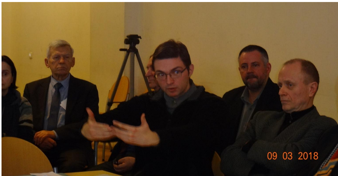
Pirmieji posėdžiai 2018-03-09