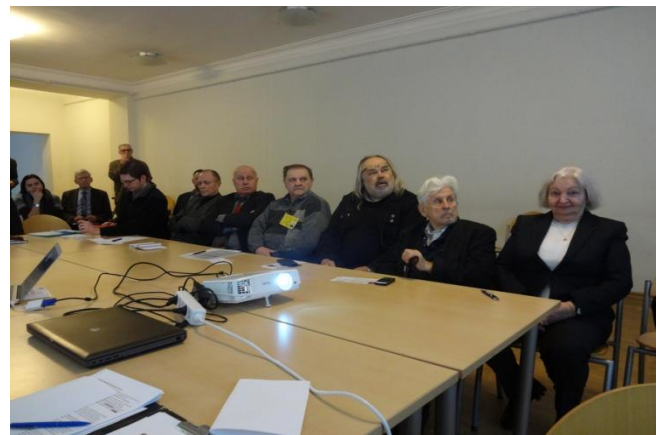
2018M. Pirmieji INICIATYVINĖS GR. posėdžiai VILNIUJE