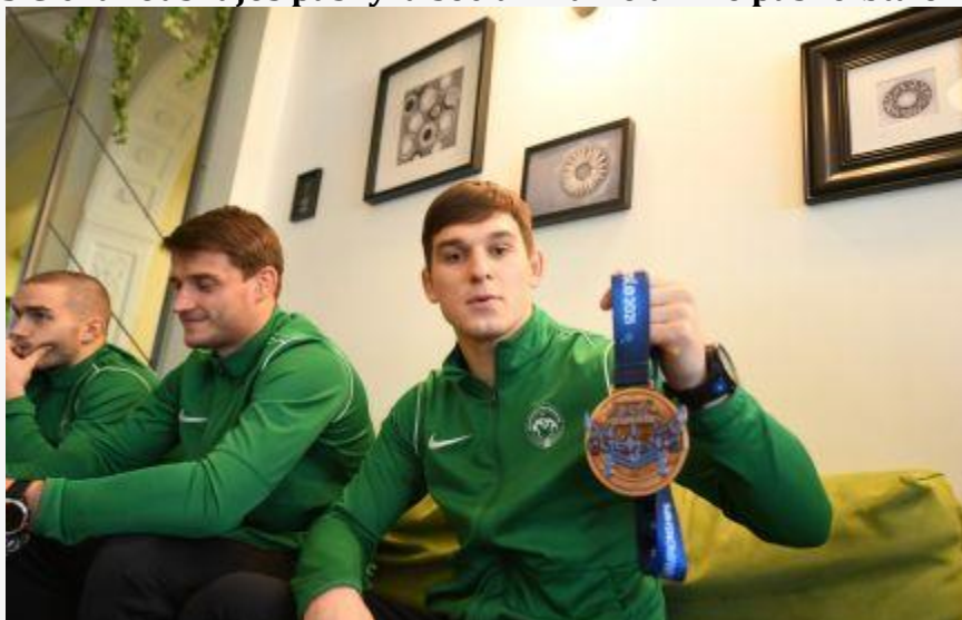
Mažais žingsniais didelių tikslų link