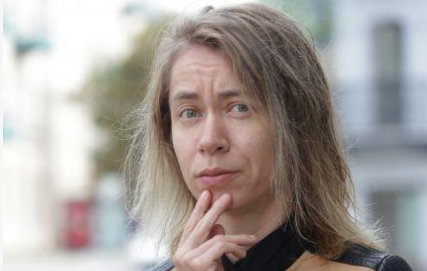
N.Vasiliauskaitė apie V.Landsbergio įrašą: Tai atviras grasinimas ir signalas SKVERNELIS FRAKCIJA DOTACIJA PAPIRKIMAS