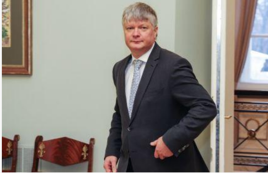
K. Navickas: parama nuo COVID-19 nukentėjusiems ūkininkams pasiekė ribą