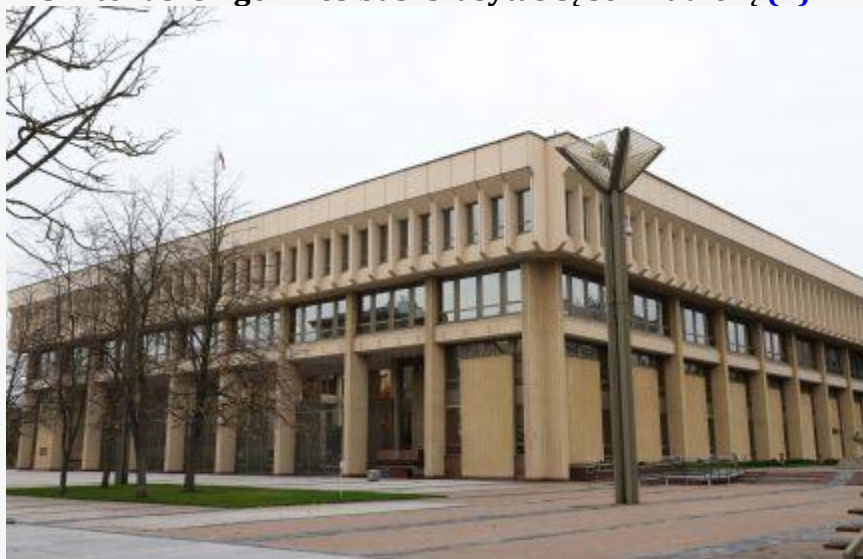
Seime bus svečių: viešės Nyderlandų Karalystės parlamento delegacija (9)