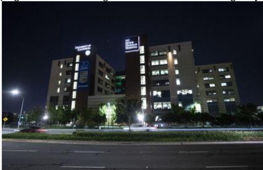
B. Clintonas iš ligoninės bus išrašytas šį sekmadienį (2)