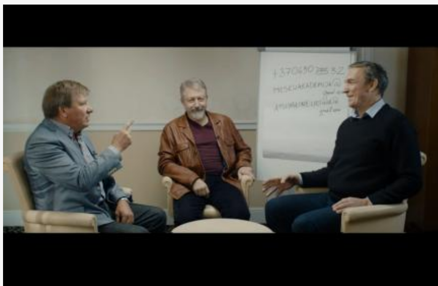
Po „Respublikos“ vėliava (2)