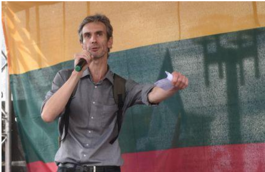
Algirdas PALECKIS: Daugumos Susivienijimas Už Žmogiškumą (251)