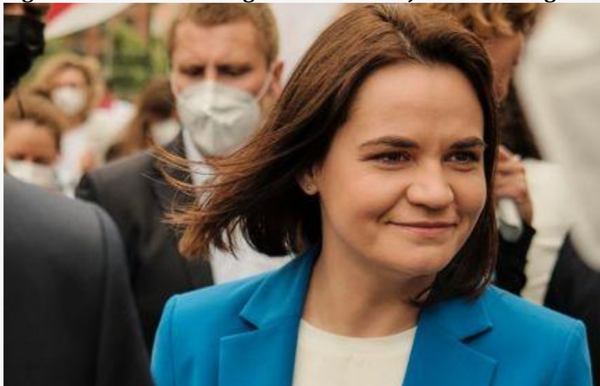
S.Cichanouskajos paskyra socialiniame tinkle paskelbta ekstremistine (83)