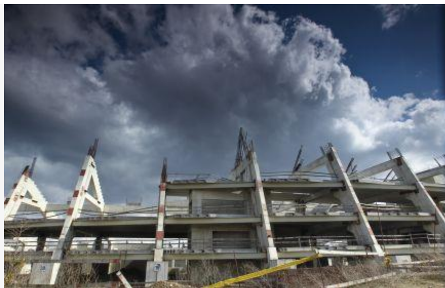
Nacionalinė afera su Landsbergių prieskoniu (165)