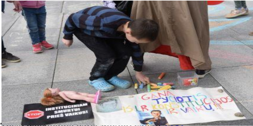
Tėvai pageidauja patys aukti vaikus [20]