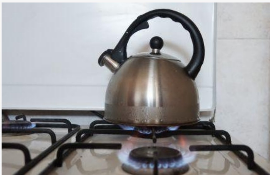
Ukrainiečius patikino, kad energetinės krizės nebus (40)