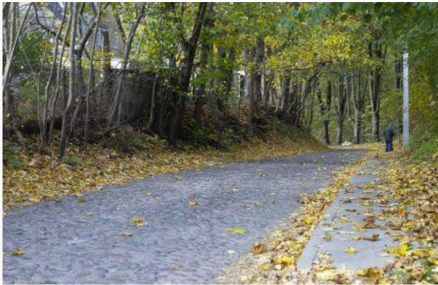
Kelininkai: kelių dangos sausos tik pietų Lietuvoje