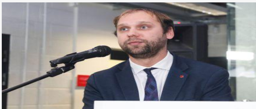
ITO įvertinimas: Lietuva - tarp 9 geriausiai darniuosius viešuosius pirkimus vykdančių šalių