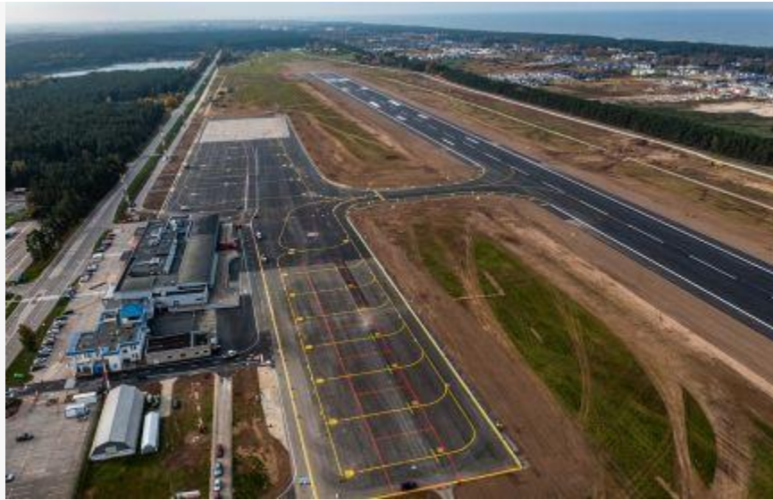
Modernizuotas Palangos oro uostas bus atidarytas kitą savaitę