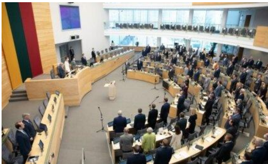
Seime galutinis balsavimas dėl narkotikų dekriminalizavimo.

prioritetinių klausimų – mažo kiekio narkotinių medžiagų dekriminalizavimo. Ši iniciatyva jau įveikė visas reikalingas stadijas, todėl lieka paskutinis žingsnis – balsavimas priėmimo etape.