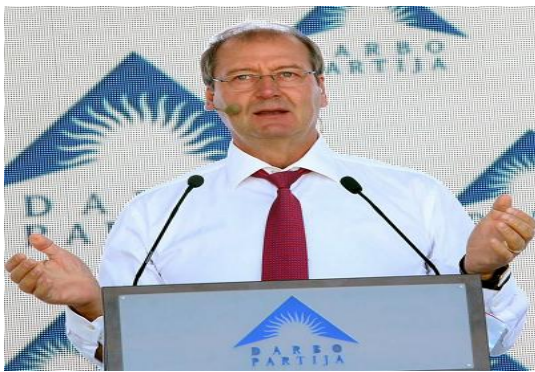
Viktoras Uspaskich.

Spalio 10-ą dieną, savo Facebook paskyroje ykdytos tiesioginės transliacijos metu, Viktoras Uspaskichas pasakė, jog remtų pilietinius protestus dėl trijų klausimų.