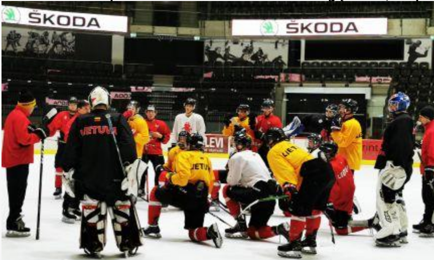
Jaunimo rinktinės stovyklos starte: treneriams patikęs žaidėjų aktyvumas