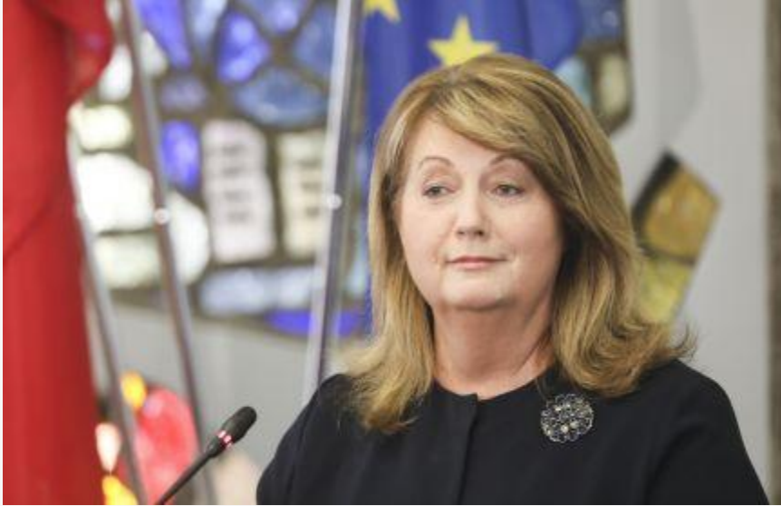
V. Blinkevičiūtė apie mokamus testus: tai valdančiųjų klaida, vėl priešinami žmonės (7)